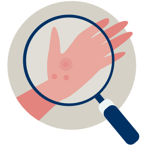
Dermatología (cuidado de la piel)