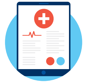
Servicios de monitoreo remoto para informar el tratamiento de su médico de una enfermedad en curso o aguda

para tratar condiciones como sinusitis, dolor de espalda, infección de las vías urinarias, erupciones cutáneas comunes, etc.