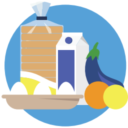
Asesoramiento sobre alimentación