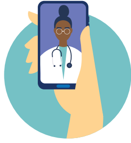
Atención médica general, como visitas de bienestar

Su médico decidirá si la telemedicina es adecuada para sus necesidades de salud. Por ejemplo, puede obtener: