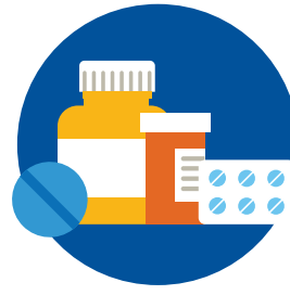
Recetas para medicamentos