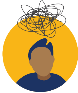
Asesoramiento sobre salud mental